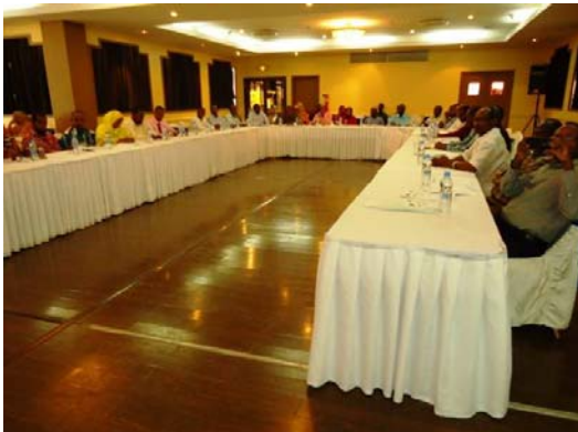
Salle utilisée au cours des deux premiers jours de la formation

La première salle dans laquelle la formation s'est déroulée les deux premiers a été de par sa superficie et son volume très satisfaisante pour l'effectif des participants. La seconde salle dans laquelle les participants ont dû migrer pour continuer la formation au cours des trois derniers jours, a été toute aussi confortable, mais semblait exigüe.