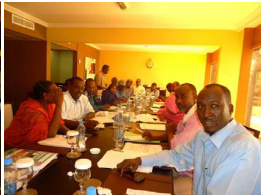
Salle utilisée au cours des trois derniers jours de la formation

Les participants ont pu bénéficier tous les jours de pauses café et de déjeuners également satisfaisants.